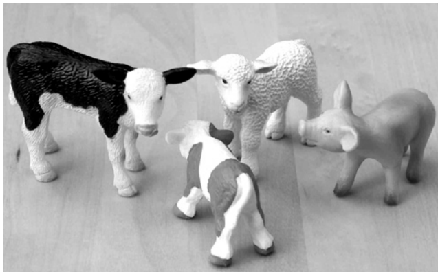
Abb. 5: eine eher friedliche Atmosphäre im Team