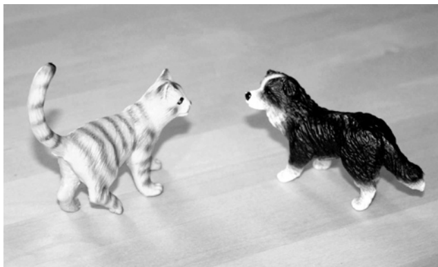
Abb. 3: wie Hund und Katze

Wenn wir sagen, zwei Menschen verhalten sich wie Hund und Katze, dann versuchen wir, einen Aspekt ihrer Beziehung genauer zu beschreiben (Abb. 3). Die Metapher soll ausdrücken, dass sie sich viel streiten oder lieber aus dem Weg gehen, weil das Streitpotenzial zwischen ihnen sehr groß ist.