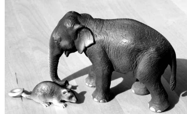
Abb. 4: Maus und Elefant

Es ist nicht unbedingt nötig, für jeden Beziehungsaspekt eine gebräuchliche Tiermetapher zu finden. Legt man den Teammitgliedern eine genügend große Auswahl an Tierfiguren vor und fordert sie auf, ihre Beziehungen untereinander mittels der Tierfiguren darzustellen, bringt man diese in eine effektive Suchhaltung. In der Regel findet das Team Tierfiguren, die ihrem Beziehungskonstrukt entsprechen, wie beispielsweise Maus und Elefant (Abb. 4).