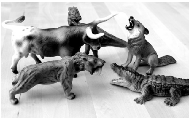
Abb. 6: eine eher aggressive Atmosphäre im Team