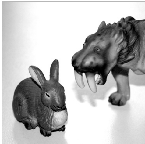
Abb. 1: Arbeit mit inneren Persönlichkeitsanteilen

figuren entnahm ich dem Bauernhof meiner Kinder. In der nächsten Sitzung legte ich ihm die Tiere vor und bat ihn, für sich selbst und für seinen inneren Schweinehund je eine Tierfigur auszusuchen und diese so aufzustellen, dass die Beziehung zwischen den beiden Anteilen sichtbar würde. Die Wirkung war erstaunlich, er stellte auf (siehe Abb. 1) und fing sofort an zu reden. Er schilderte den seit Jahren andauernden Kampf zwischen sich (Hase) und seinem inneren Schweinehund (Säbelzahniger). Mein Ziel war es, die beiden irgendwie miteinander zu versöhnen bzw. Anreize zu schaffen, die die Beziehung zwischen den inneren Anteilen verändern. Was dann kam, war Beraterische Routine: zirkuläre und unterschiedsbildende Fragen. Diese Erfahrung veranlasste mich, mit Tierfiguren in verschiedenen Beratungskontexten zu experimentieren. Nachfolgend wird eine Arbeitsmöglichkeit mit Tierfiguren für die systemische Teamsupervision bzw. Teamentwicklung vorgestellt.