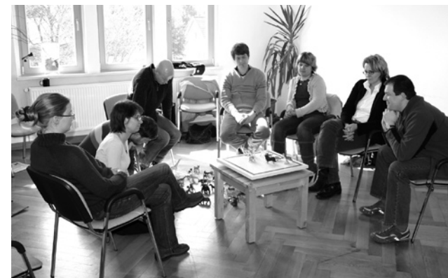
Abb. 7: Team in Tieren – Anwendungsbeispiel