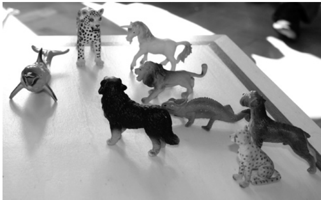
Abb. 8: Aufstellung – Anwendungsbeispiel

Das Beispiel (Abb. 7 und 8) zeigt ein Team in Tierfiguren. Hier bat ich die Kollegen, sich selbst als Tierfigur zu beschreiben, das heißt jeder Einzelne sollte für sich selbst eine Tierfigur finden. Die Instruktion lautete etwa: „Tiere werden oft zur Beschreibung menschlicher Eigenschaften und Fähigkeiten benutzt. Ich bitte euch, euer eigenes Verhalten oder spezielle Persönlichkeitsanteile sowie eure Beziehungen zueinander mit einer Tierfigur auszudrücken! Achtet dabei nicht nur auf euch selbst, sondern auch auf die Beziehungsgestaltung insgesamt!“ Nun war etwas Zeit nötig, jeder suchte sich aus der Tierfigurensammlung ein Tier heraus. Die nächste Instruktion lautete: „Stellt nun eure Tierfiguren auf das Brett. Versucht dabei eure Erfahrungen miteinander und die Beziehungen untereinander unter dem Aspekt Nähe und Distanz auszudrücken! Das heißt, wer steht eher neben wem und wie nah? Die Tierfiguren können dabei ihre Positionen immer wieder verändern, bis sich für jeden Kollegen ein annähernd stimmiges Bild ergibt. Bitte spricht während der Aufstellung nicht, konzentriert euch auf die Position aller Tierfiguren und auf die den Tieren typischerweise zugeschriebenen Eigenschaften!“ Dieser Prozess kann mitunter ein bis zwei Minuten dauern. Es entstand die abgebildete Aufstellung (Abb. 8).